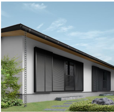
「取替雨戸パネル」施工例