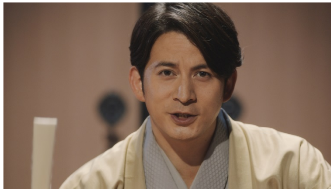
新 CM 「講談師/トイレの嘸」 篇

株式会社 LIXIL は、岡田准一さんを起用した INAX トイレ新 CM 「講談師/トイレの嘸」 篇を、2019 年 8 月 16 日（金）から、全国で放映します。