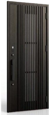
V31型 格子正面のふっくらとした形状や、天然木の経年変化である痩せを再現するなど細部にまでこだわったデザイン。

※LIXIL Design Style : https://www.lixil.co.jp/lineup/designstyle/