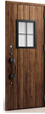
V42型 採光用の窓にシンプルな格子の鋳物を組み合わせたデザイン。格子を細くすることで、軽やかでモダンな印象に。

また、時代観に合わせた、自然な濃淡や触り心地の表現にこだわった新色として、“神代木”をイメージし独特の深みのある色合いが神秘的な重厚さを感じさせる木目の「ディープエルム」と、北欧スタイルの中でも、より大人っぽくスッキリとしたデザインに合わせた塗装木目の「ユーログレーパイン」の2色を追加します。