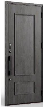
V34型 伝統的な欧風装飾であるモールディングを現代風にアレンジ。縦長のプロポーションが上品でモダンな佇まいに。